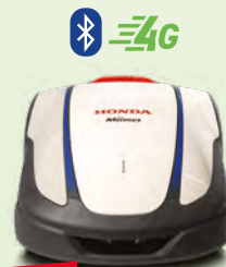
NEU HRM 2500 Live