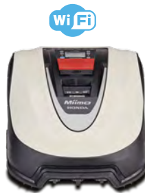
HRM 70 Live