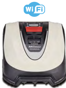
HRM 40 Live