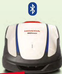
NEU HRM 1500

Grosse Gärten mit Bäumen oder Landschaftsgärten sowie grosse Rasenflächen werden das ganze Jahr über gemäht und Sie können sich um Ihre Rosen kümmern oder einfach nur entspannen.