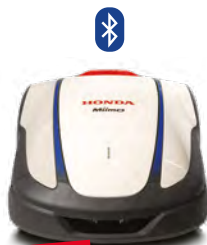
NEU HRM 2500