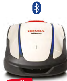
NEU HRM 1000