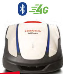
NEU HRM 1500 Live