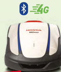
NEU HRM 4000 Live