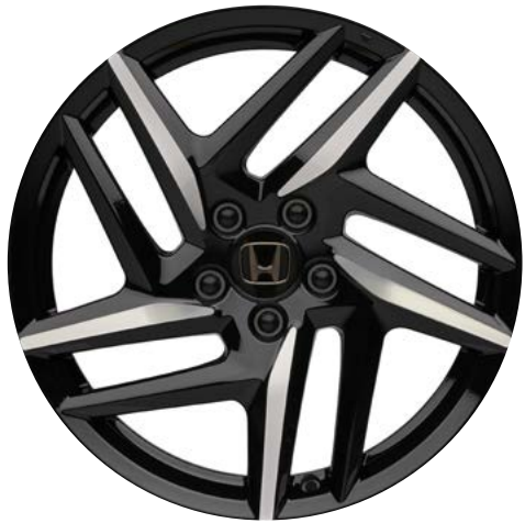
19-ZOLL-LEICHTMETALLFELGE PR1901 Die 19-Zoll-Leichtmetallfelge PR1901 verfügt über eine diamantgeschliffene A-Oberfläche mit glänzenden, klar beschichteten Ausschnitten in Berlina Black.

Die Paketbestandteile sind auch einzeln erhältlich. Abgebildet sind die 19-Zoll-Leichtmetallfelgen PR1901, optional und separat erhältlich. Das abgebildete Modell ist der Prelude Advance in Meteoroid Grey Metallic.