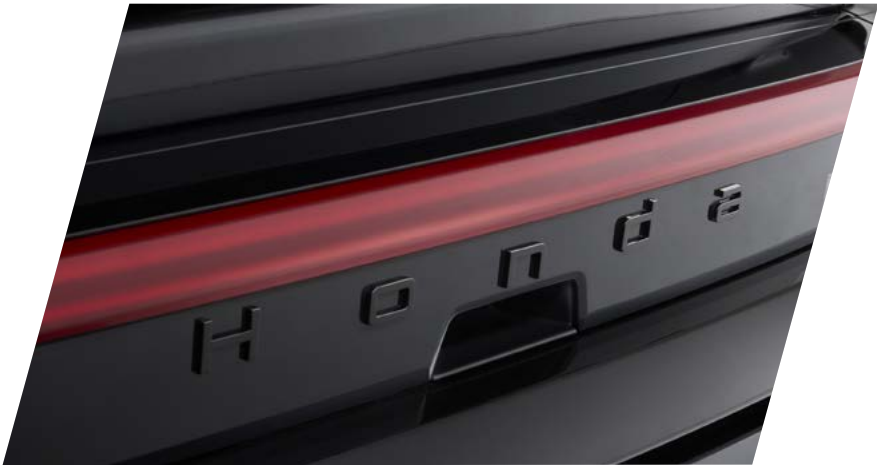
SCHWARZES EMBLEM-SET Auf die Details kommt es an. Das schwarze Emblem-Set ergänzt den sportlichen Look des Prelude perfekt. Dieses Set enthält: ein schwarzes H-Zeichen aus Chrom für die Front und ein schwarzes Honda Logo für das Heck.