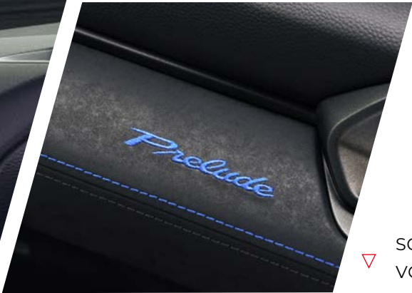
SOFT-TOUCH-MATERIALIEN VORDERSITZE MIT LEDERBEZUG