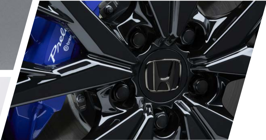
SCHWARZE EMBLEM-NABENDECKEL Die schwarzen Nabendeckel mit schwarzem H-Zeichen aus Chrom ergänzen den sportlichen Look der Räder Ihres Prelude perfekt. Im Set sind vier Stück enthalten.