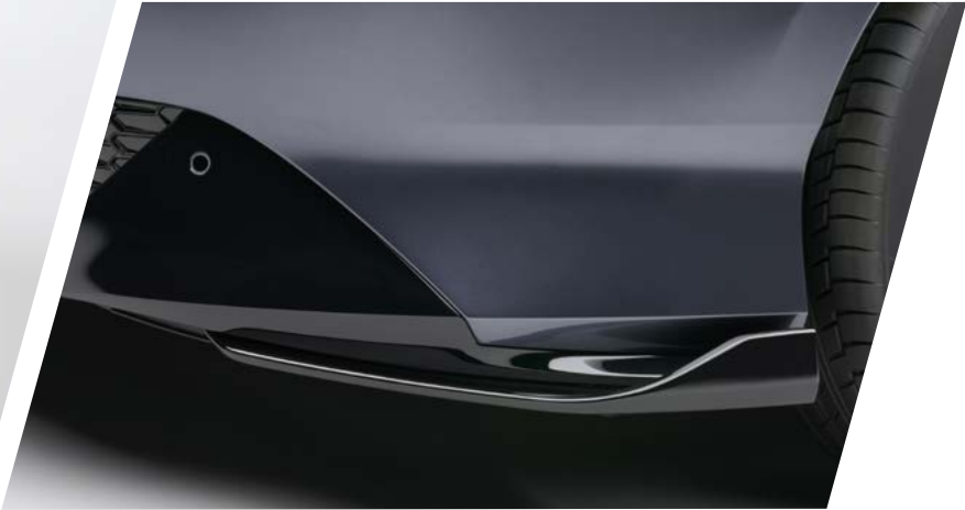
ZIERLEISTEN FÜR DIE VORDERE STOSSSTANGE Verändern Sie die Optik Ihres Prelude mit unseren Zierleisten für die vordere Stossstange. Diese Akzente verleihen Ihrem Fahrzeug einen besonderen Touch und sorgen für einen auffälligen, stilvollen Look.