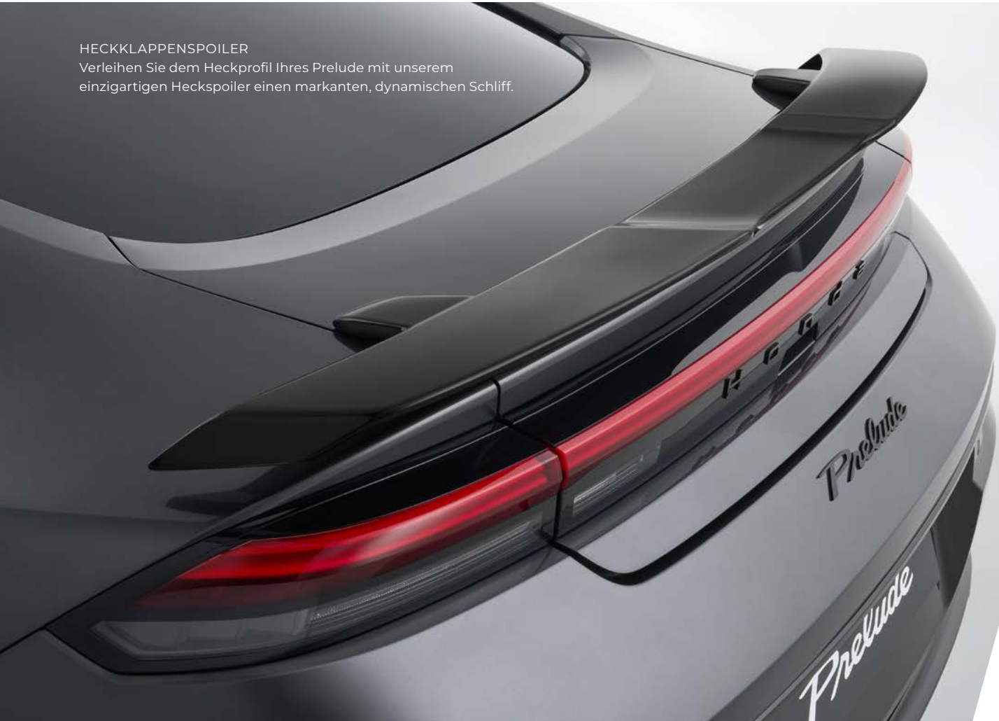
HECKKLAPPENSPOILER Verleihen Sie dem Heckprofil Ihres Prelude mit unserem einzigartigen Heckspoiler einen markanten, dynamischen Schliff.