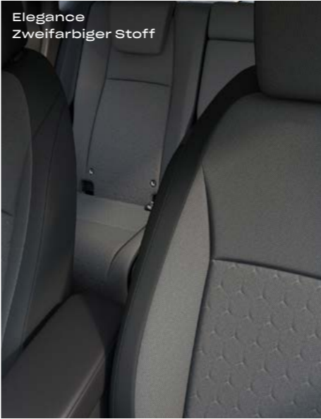
Elegance Zweifarbiger Stoff