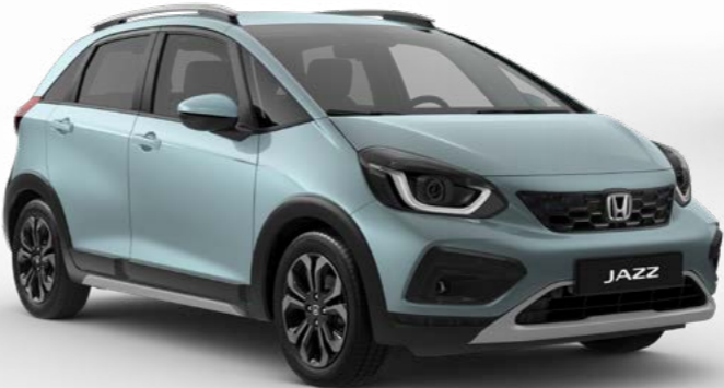
Fjord Mist Pearl