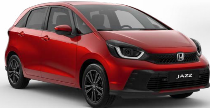
Rot Premium Crystal