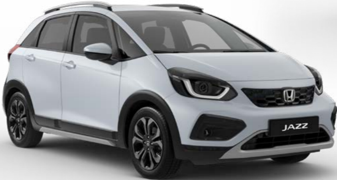
Weiss Premium sunlight