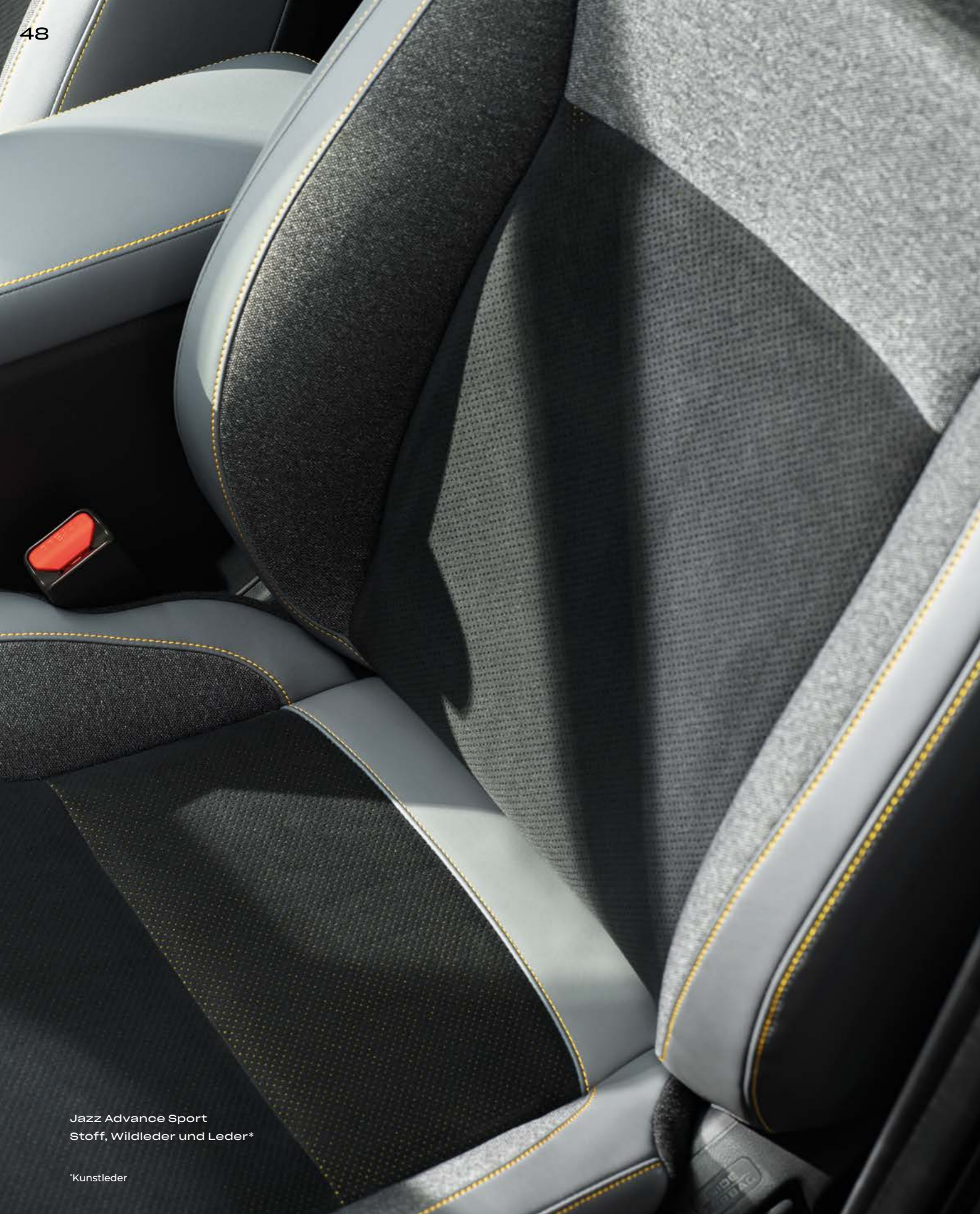
Jazz Advance Sport Stoff, Wildleder und Leder*