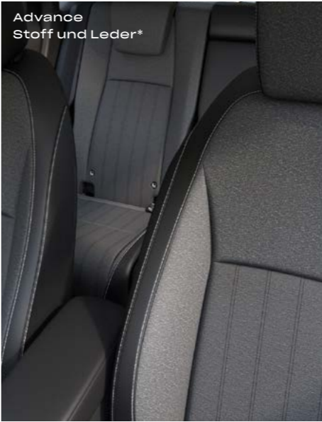
Advance Stoff und Leder*