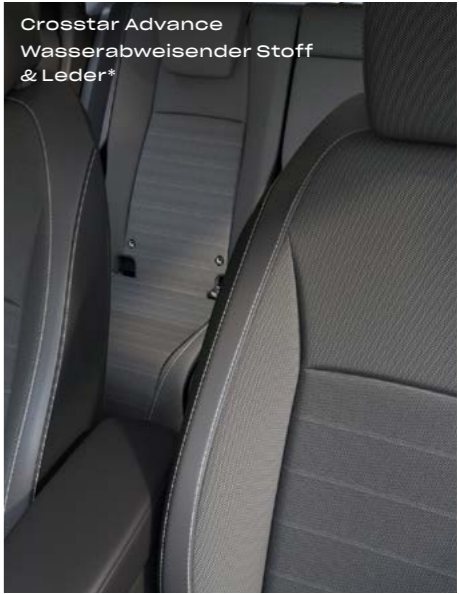
Crosstar Advance Wasserabweisender Stoff & Leder*